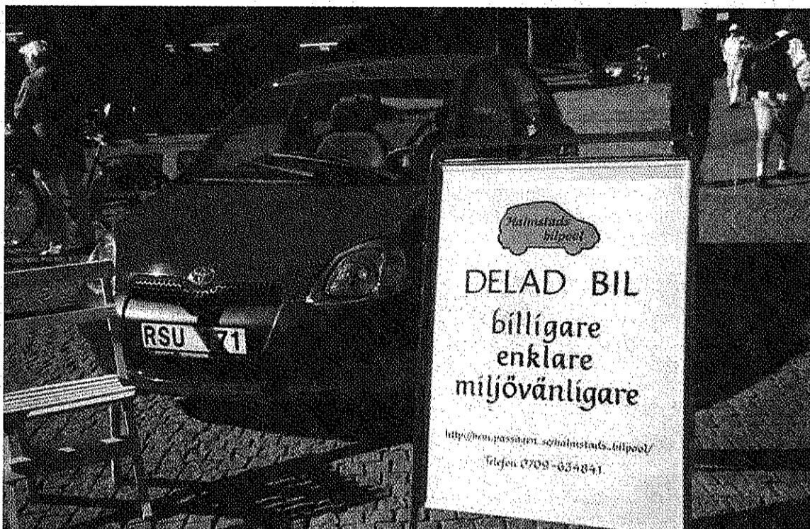
Många har upptäckt fördelarna med att kunna dela på kostnader och underhåll för en bil.

Bilpooler innebär vinster för kommunen. Gång och cykel är bäst för korta transporter. Välutbyggd kollektivtrafik fungerar för de flesta på längre sträckor, men det kommer alltid att finnas ett behov av bil när det gäller transporter av tyngre eller större saker och resor mellan platser där kollektivtrafiken inte kan erbjuda bra lösningar. Vid dessa tillfällen kan många välja bilpool. Nyttan för kommunen är på sikt minskade utsläpp, minskad trängsel samt mindre ytor till parkering. Det finns kommuner som lägger in bilpooler i samhällsplaneringen och till exempel ser till att bostadsföretag vid nybyggnation planerar för bilpool. Detta minskar behovet för parkering och är